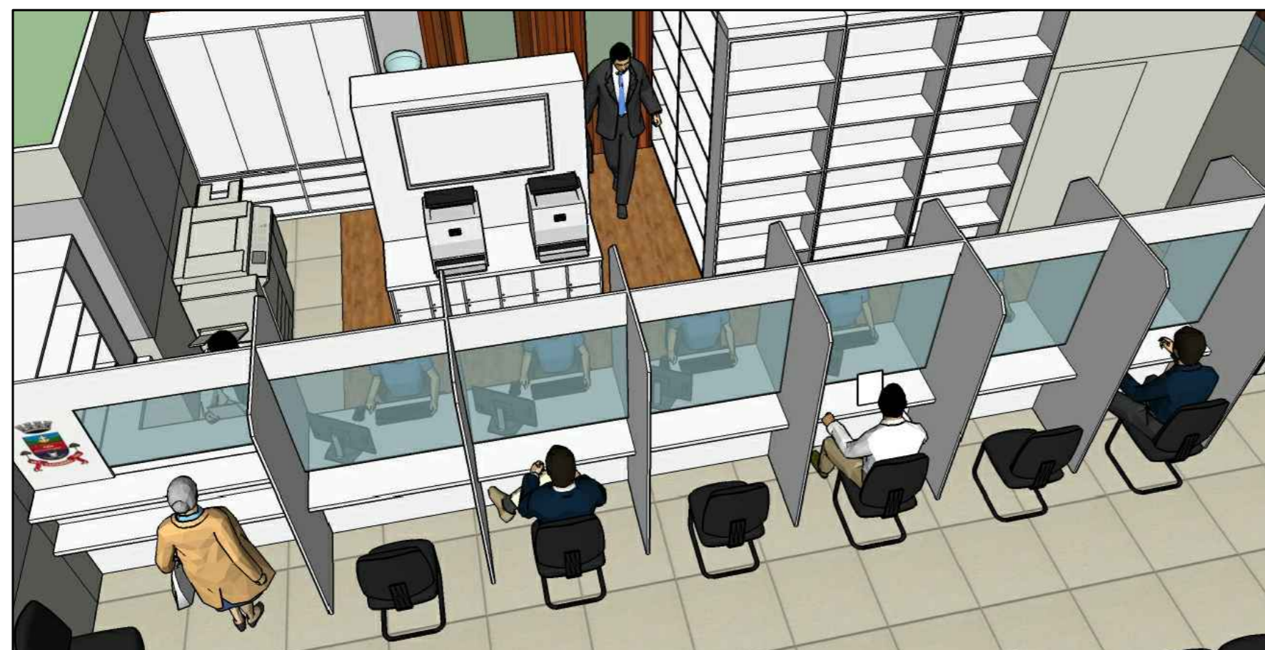
*imagens meramente ilustrativas