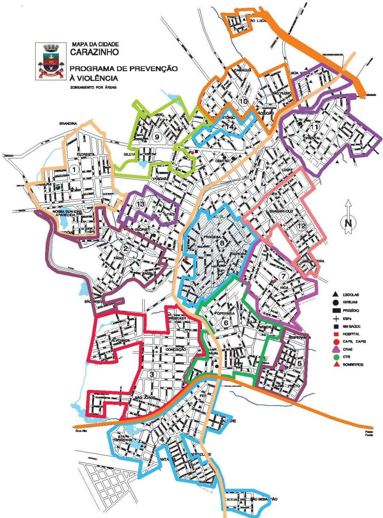
ANEXO III FORMULÁRIO DE RECURSO